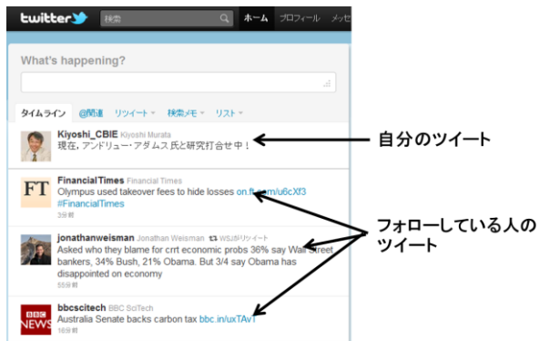
あなたがあなたのツイッターを見たとき

「ツイッター」はケータイやパソコンを使って自分のしていることや思っていることを、そのとき、その場で、気軽に世界中のインターネット利用者（ユーザー）に向かって140字以内で「つぶやく」（「ツイートする」といいます）ことができる、とても人気のあるサイトです。